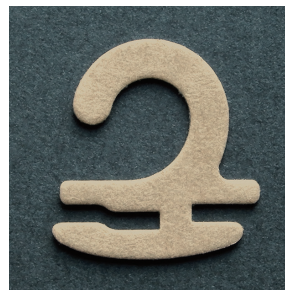
TEF-01N (旧BD-12) w27×h28.5mm